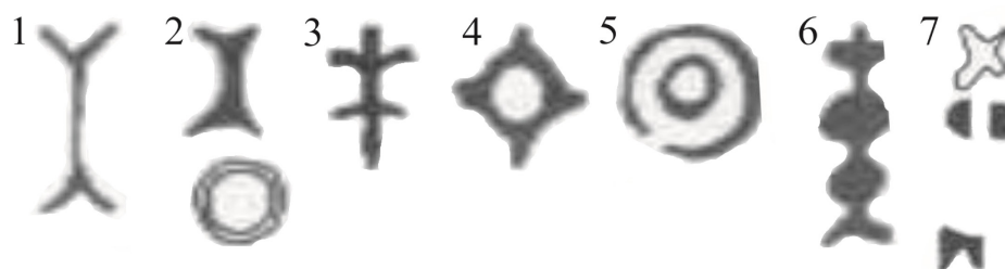
Рис. 3. Клейма на ножах и ножницах, Лондон

ются на английских ножах XIV века [7, р. 22, № 262] (рис. 3. 3) в музее Кастельвеккьо в Вероне хранится миланский меч XVI века с клеймом в виде такой же лилии 8 .